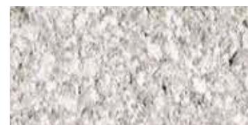
bocciardato / bush-hammered / gestockt